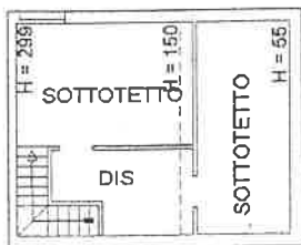
Pianta Piano Terzo