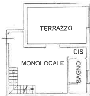
Pianta Piano Secondo H = 270